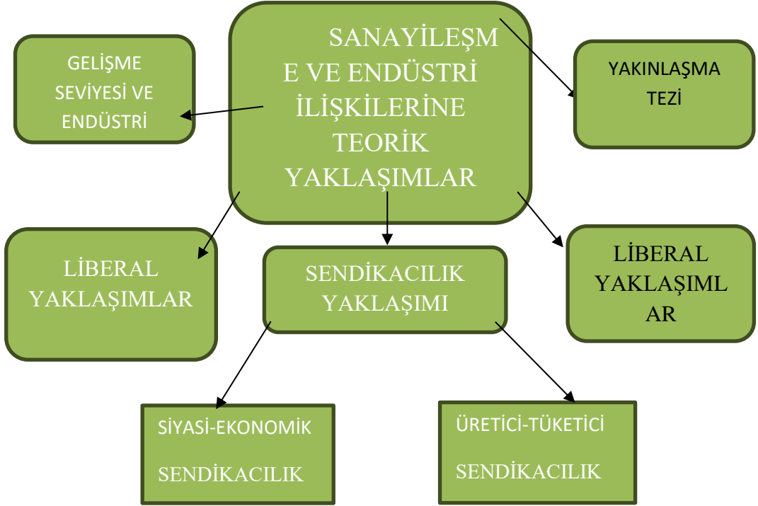
Tablo 2. Endüstri İlişkilerine Kuramsal Yaklaşımlar (Makale Ve Yayınlar İncelenerek Hazırlanmıştır)

Bu bağlamda, endüstri ilişkilerine kuramsal yaklaşımlar aşağıda tabloda gösterilmektedir.